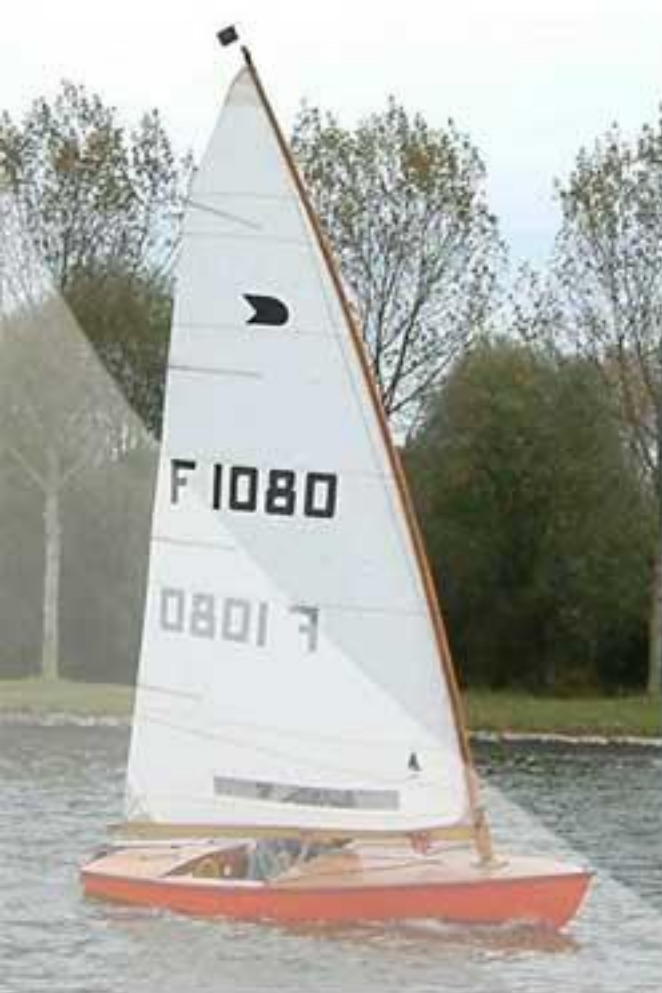
( La Yole-OK)

Une cinquantaine de cotisants en France , plus de 100 en Angleterre , Allemagne , Danemark , Nouvelle Zélande ou encore Australie